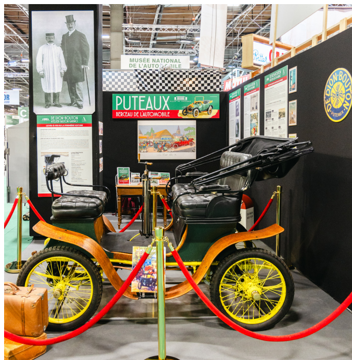
La voiture vis-à-vis De Dion-Bouton exposée au salon Rétromobile 2024

Les vis-à-vis, produites de 1899 à 1902, sont équipées d'un moteur monocylindrique qui se démarre avec une manivelle placée sur le côté conducteur. Elle se conduit grâce à une colonne de direction, ancêtre du volant, munie de 3 manettes pour tourner, reculer, et changer de vitesse. C'est la première automobile fabriquée en grand nombre avec 2 970 exemplaires sortis jusqu'en 1902. La clientèle pouvait même personnaliser son véhicule notamment sur le choix de la capote, de l'emplacement des phares (à pétrole) ou encore des banquettes. Il ne restait plus qu'à voyager cheveux au vent à 25 km/h !